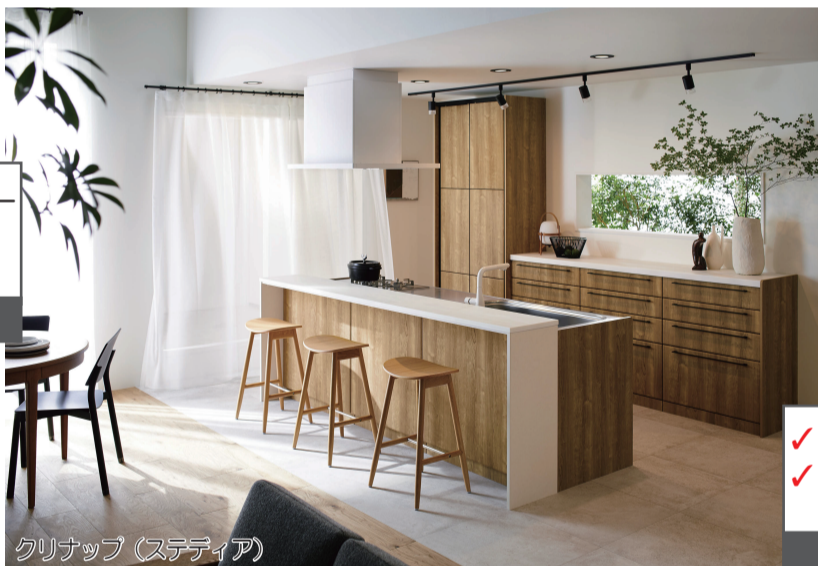
クリナップ (ステディア)

✓ちょうどいい高さで手元を 隠してくれる ✓開放感があって家族と コミュニケーションもとれる 補助額 91,000 円